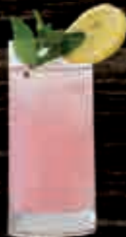
MoGU® Lechee € 6,50