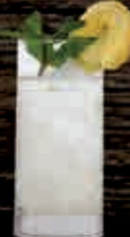
MoGU® Coconut € 6,50