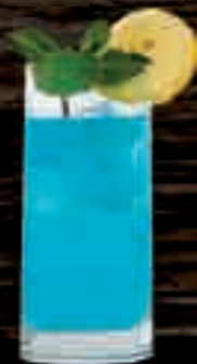
MoGU® Blackcurrant € 6,50