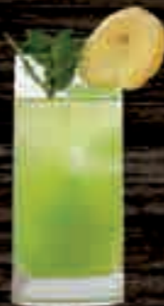
MoGU® Melon € 6,50