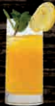
MoGU® Mango € 6,50